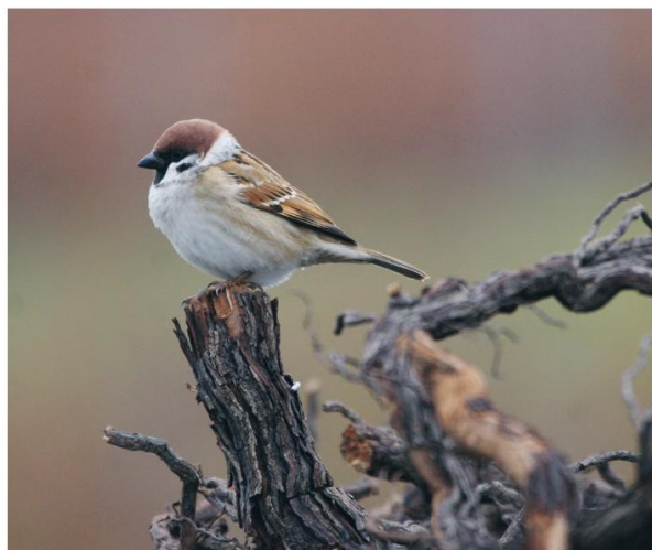
Moineau friquet © Yves Menétrey